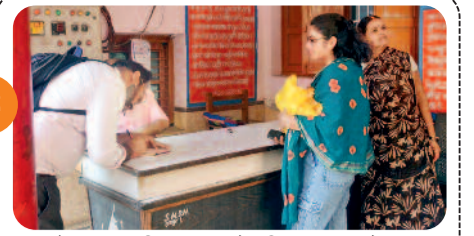
चैत्र नवरात्रि उत्सव के लिए सज रहे ...